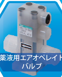
薬液用エアオペレート バルブ