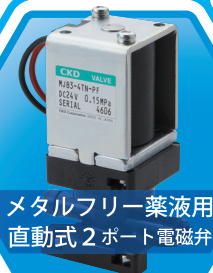
メタルフリー薬液用 直動式2ポート電磁弁