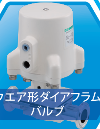
ウエア形ダイヤフラム バルブ