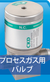
プロセスガス用 バルブ