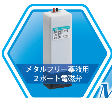
メタルフリー薬液用 2ポート電磁弁