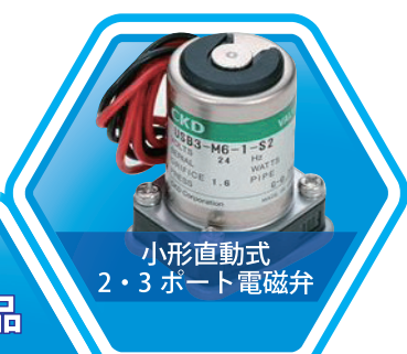
小形直動式 2・3ポート電磁弁