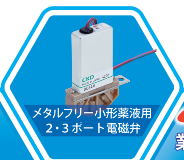
メタルフリー小形薬液用 2・3ポート電磁弁