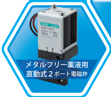
メタルフリー薬液用 直動式2ポート電磁弁