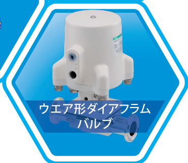
ウエア形ダイヤフラム バルブ