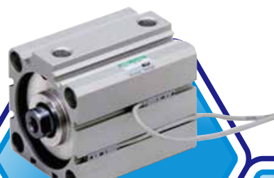
空気圧 アクチュエータ