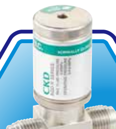
ドライファイン機器