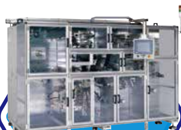
リチウムイオン電池 捲回機