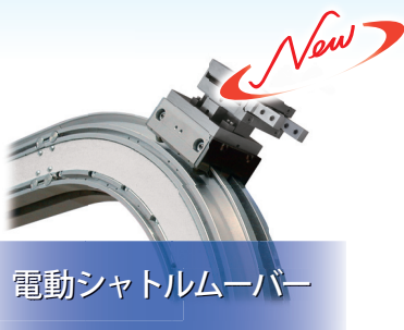
電動シャトルムーバー