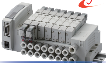
パイロット式 3・5ポート弁