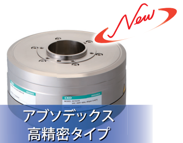
アブソデックス 高精密タイプ