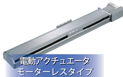
電動アクチュエータ モーターレスタイプ